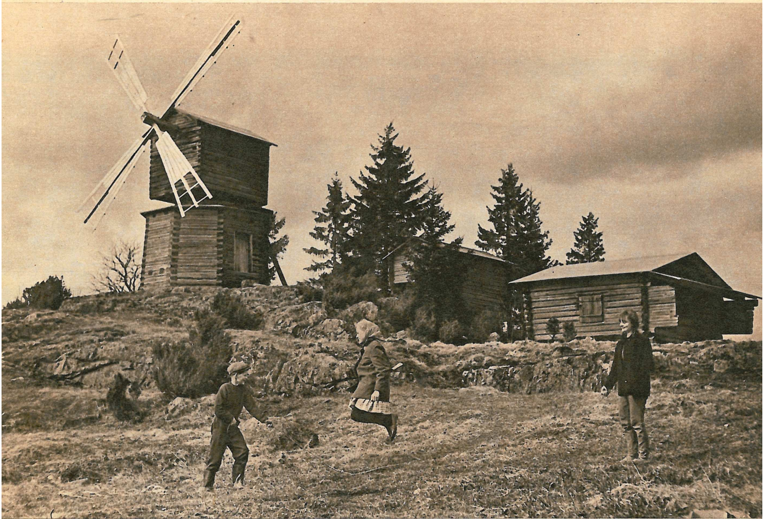
VANHA ja uusi aika lyövät kättä vielä Suodenniemen kirkonkylässä. Tuulimylly tuntee synkkiä tarinoita, mutta uuden ajan suodenniemeläisillä on edessään pitkä ja valoisa elämä.

ryillä hiekkaa ja hiilimurskaa, raatoivat otsat hiessä. Ja niin valmistui omin voimin uusi urheilukenttä.